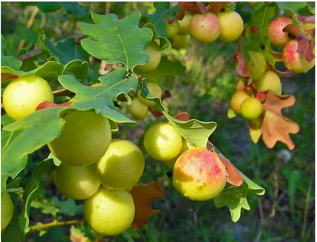
Galläpplen, en viktig ingrediens i medeltida bläck.